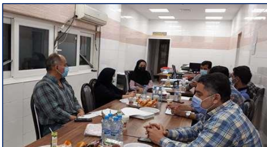
بازدید کارشناسان دفتر توسعه منابع فیزیکی و امور عمرانی وزارت بهداشت از پروژه های عمرانی دانشگاه ۱۴۰۰/۰۴/۰۷