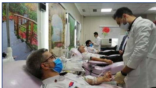
تکنسین های فوریت های پزشکی دانشگاه علوم پزشکی استان سمنان در صف اهداء خون ۱۴۰۰/۰۴/۱۳