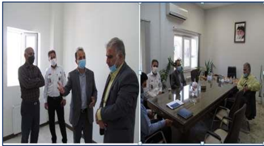
بازدید فرماندار شهرستان آرادان از پایگاه های اورژانس پیش بیمارستانی شهرستان ۱۴۰۰/۰۴/۰۱