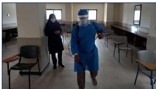
نظارت بر حسن اجرای دستورعمل های بهداشتی در آزمون های سراسری دانشگاه ۱۴۰۰/۰۴/۱۴