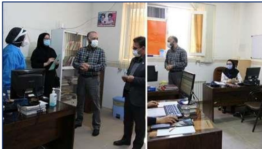
بازدید تیم نظارتی معاونت بهداشتی دانشگاه از پایگاه جمعیتی واکسیناسیون و مرکز منتخب کرونا شهرستان گرمسار ۱۴۰۰/۰۴/۱۴