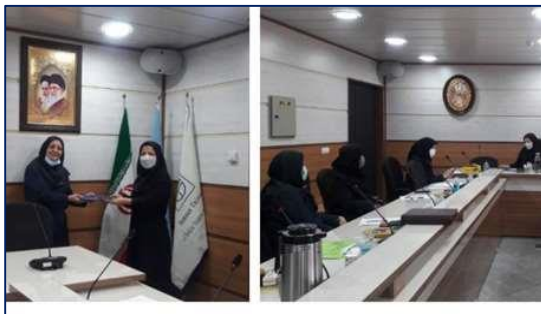
برگزاری جلسه کمیته آموزش دانشگاه علوم پزشکی استان سمنان ۱۴۰۰/۰۴/۱۶