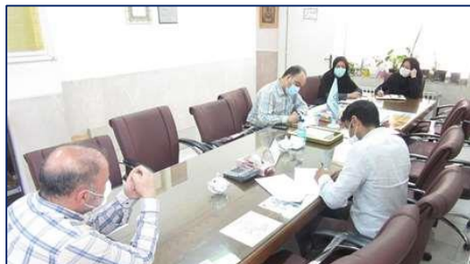
برگزاری جلسه "کمیته زندان ها" در مرکز بهداشت شهرستان سمنان ۱۴۰۰/۰۴/۱۳