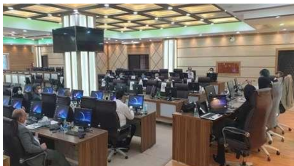
دانشگاه های علوم پزشکی گیلان و بابل به اتفاق کارشناسان مربوطه حضور داشتند.