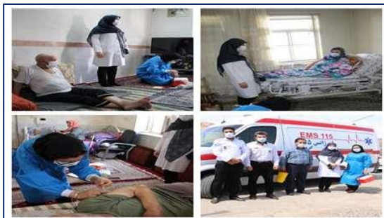
اعزام تیم سیار واکسیناسیون کرونا شهرستان گرمسار ۱۴۰۰/۰۴/۱۳