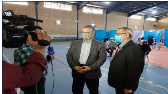
بازدید معاون فرماندار شهرستان گرمسار از مرکز تجمعی واکسیناسیون کووید-۱۹ شهرستان گرمسار ۱۴۰۰/۰۴/۲۹