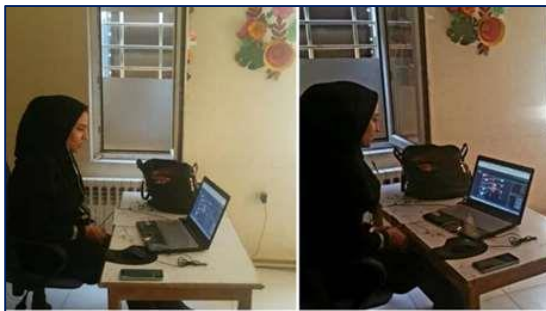
آموزش پیشگیری از سوء مصرف مواد مخدر در نوجوانان کانون پرورش فکری کودکان و نوجوانان شهرستان سرخه ۱۴۰۰/۰۴/۱۲