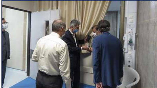
بازدید ریاست دانشگاه علوم پزشکی استان سمنان از اورژانس سوانح و مرکز سوختگی ۱۴۰۰/۰۴/۲۸