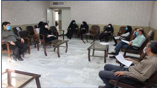
جلسه کمیته های آموزش و ساماندهی رسانه های آموزشی در شبکه بهداشت و درمان دامغان برگزار شد ۱۴۰۰/۰۴/۱۲