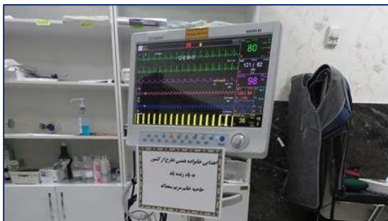
خری نیکوکار یک دستگاه مانیتورینگ کامل علائم حیاتی به بیمارستان کوثر اهدا کرد ۱۴۰۰/۰۴/۱۶