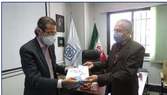
تقدیر دکتر معماریان از مدیرعامل موسسه خیریه بیمارستان کوثر ۱۴۰۰/۰۴/۲۱