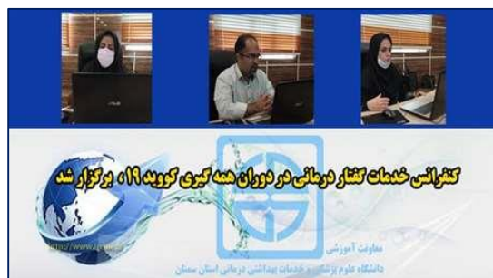
کنفرانس خدمات گفتار درمانی در دوران همه گیری کووید- ۱۹ برگزار شد ۱۴۰۰/۰۴/۱۴