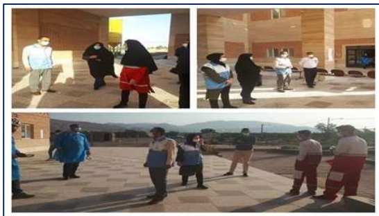
حضور کارشناسان بهداشت محیط شهرستان گرمسار در محل برگزاری کنکور سراسری ۱۴۰۰ ۱۴۰۰/۰۴/۱۲