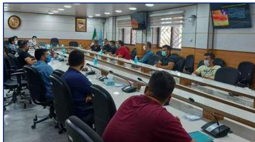
اجرای دوره آموزشی کمک های اولیه برای رانندگان برون راهی (Off roads) سمنان ۱۴۰۰/۰۴/۰۶